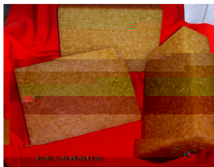
标准天然橡胶样品